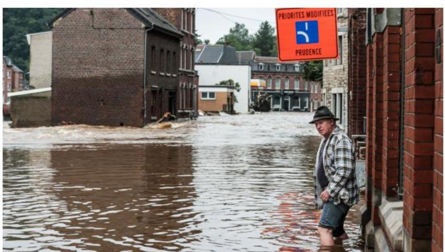
Journaliste au pôle Economie Par Dominique Berns

ACCUEIL • ECONOMIE Catastrophes naturelles : le plafond d'intervention des compagnies d'assurances multiplié par quatre Les grandes inondations wallonnes avaient démontré l'insuffisance du cadre légal de la couverture des catastrophes naturelles. Deux ans plus tard, le ministre Dermagne dévoile le premier volet d'une réforme visant à garantir l'indemnisation complète des victimes.